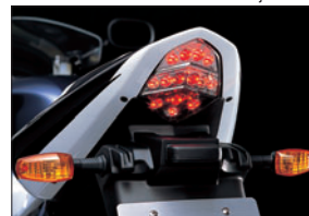
Piloto trasero LED