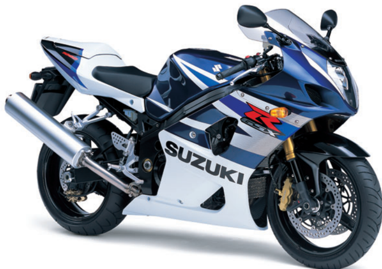
LR5: Azul Profundo 2 / Blanco Cristal Jaspeado